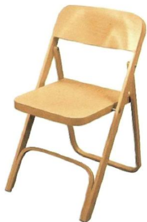
12 b Krzesło widowni