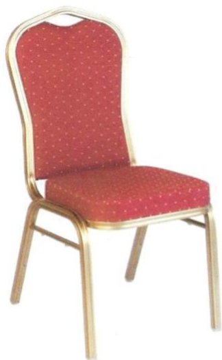
12 a Krzesło widowni