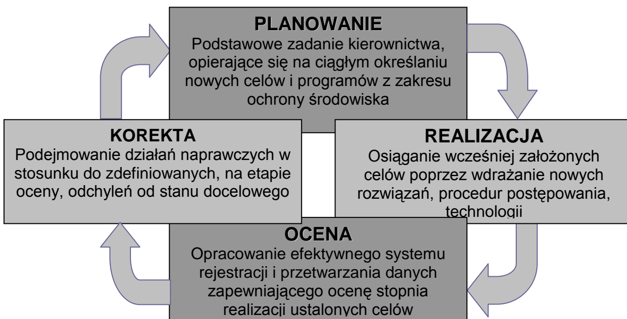
Rysunek 8.1. Schemat zarządzania Programem Ochrony Środowiska

Po tym czasie do osiągnięcia pozostaną cele, które obecnie są oceniane jako mniej ważne, a w przyszłości staną się priorytetami.