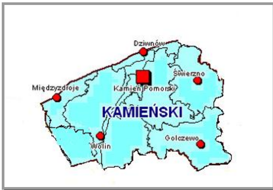
Mapa nr 2.1.1. Położenie gminy Golczewo na terenie Powiatu Kamieńskiego